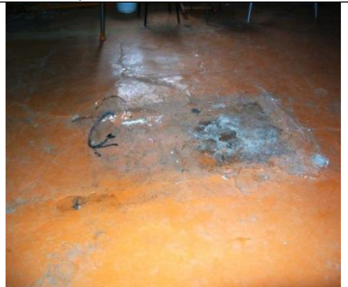
Столовая по Школьной 17, Результат протечек на полу