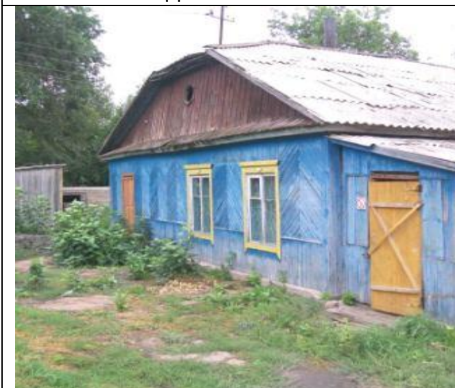
Столовая по Школьной 17, Вид с юго-запада