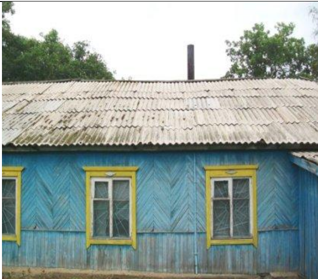
Столовая по Школьной 17, Вид с юга, прогиб крыши