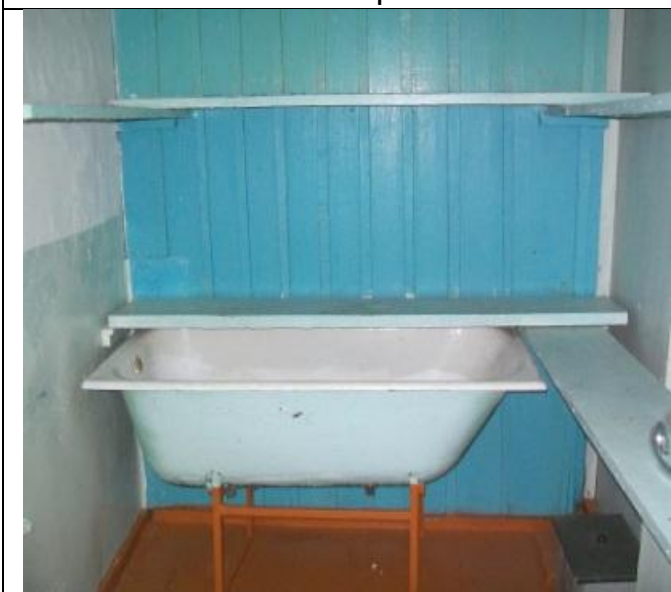
Столовая по Школьной 17, Мойка посуды