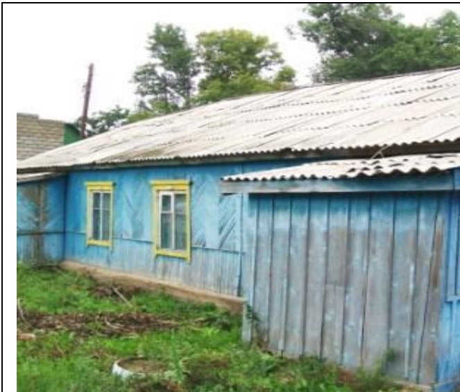
Столовая по Школьной 17, Вид с юго-востока