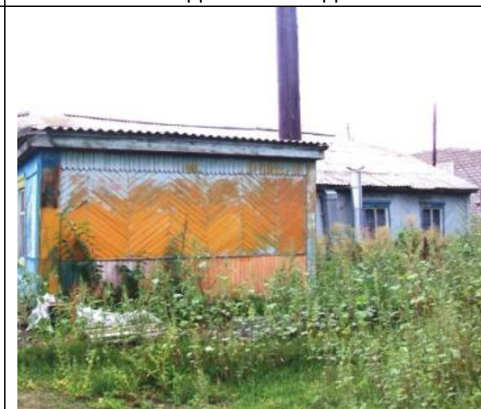
Столовая по Школьной 17, Вид с северо-востока