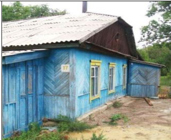
Столовая по Школьной 17, Вид с юго-востока