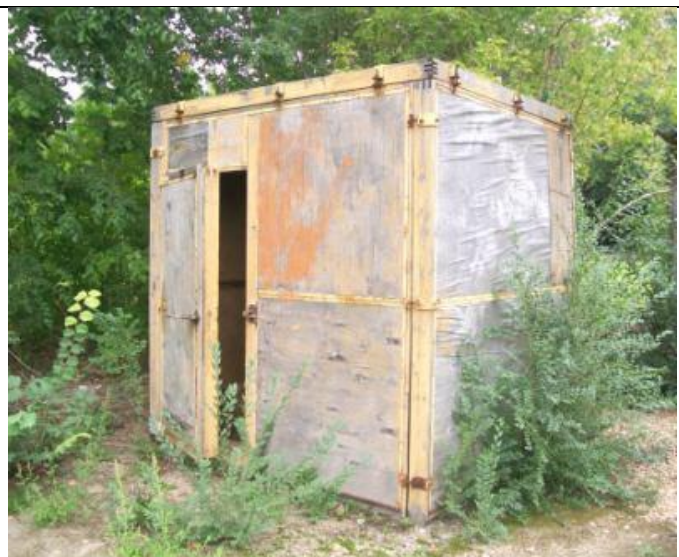
Столовая по Школьной 17, Туалет на улице