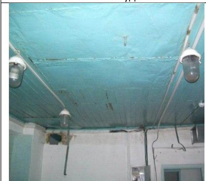
Столовая по Школьной 17, Состояние потолка