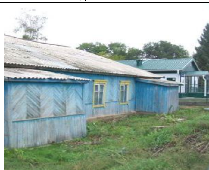
Столовая по Школьной 17, Вид с юго-запада