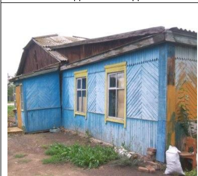
Столовая по Школьной 17, Вид с северо-востока