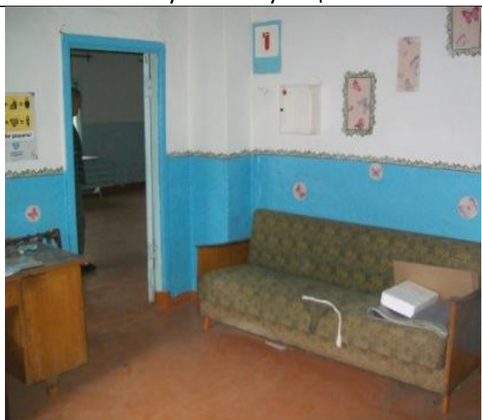
Столовая по Школьной 17, Комната администратора