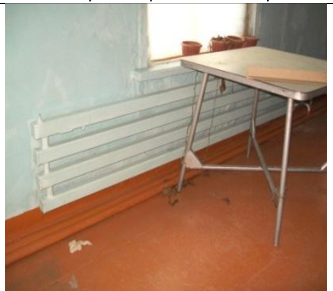
Столовая по Школьной 17, Радиаторы отопления