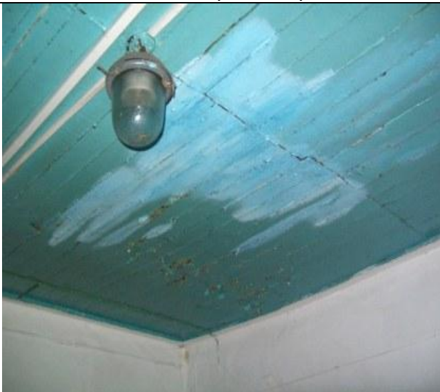
Столовая по Школьной 17, Протечки воды на потолке