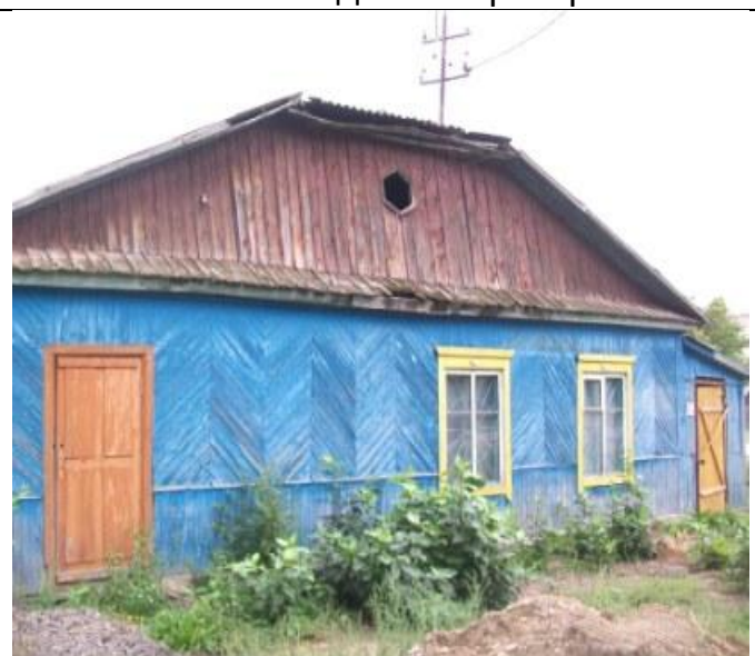
Столовая по Школьной 17, Вид с запада