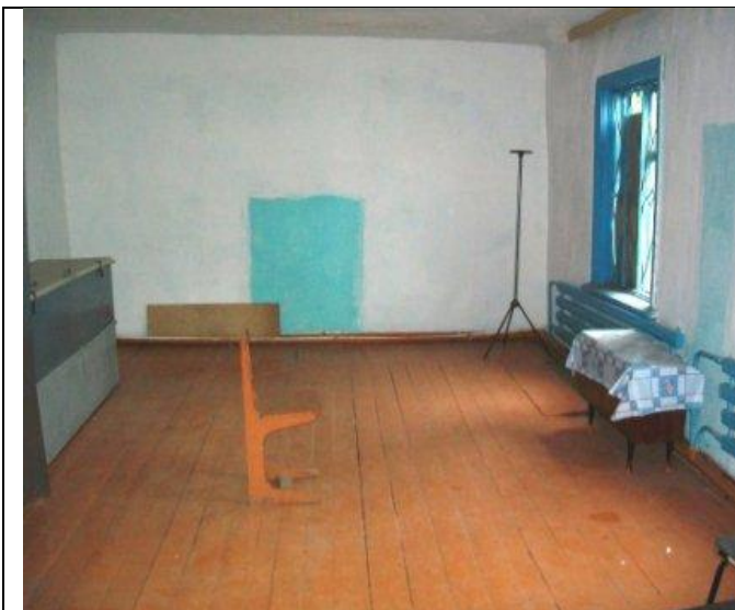
Столовая по Школьной 17, Комната персонала