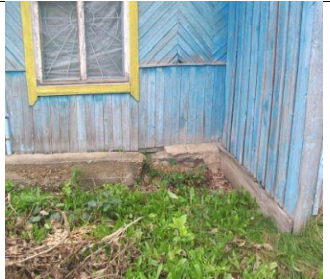
Столовая по Школьной 17, Трещины бетона в цоколе