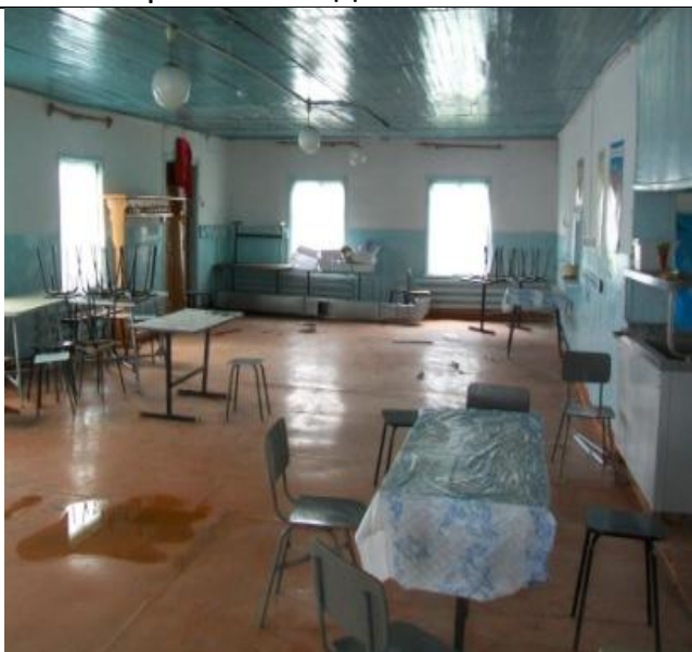
Столовая по Школьной 17, Обеденный зал