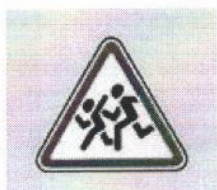
Дорожный знак 1.23 «Дети»

Предупреждающие знаки устанавливают в населенных пунктах – на расстоянии от 50 до 100 м до начала опасного участка в зависимости от разрешенной максимальной скорости движения, условий видимости и возможности размещения.