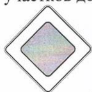
Дорожный знак 2.1 «Главная дорога»

Знаки приоритета применяют для указания очередности проезда перекрестков, пересечений отдельных проезжих частей, а также узких участков дорог.