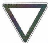
Дорожный знак 2.4 «Уступите дорогу»